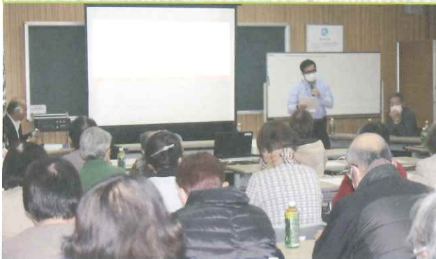
◆ 以上ですが何かご質問は・・・ (市民センター)