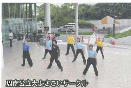
周南公立大よさこいサークル