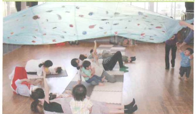
◆ お空が下りてきた (市民センター)