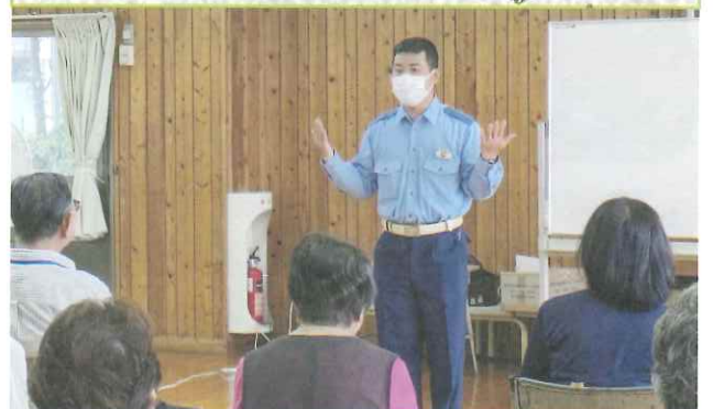
◆ 夜間の外出は控えて (岐山小学校)