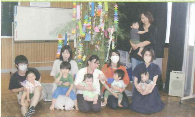
◆ 願い事かなうといいね (市民センター)