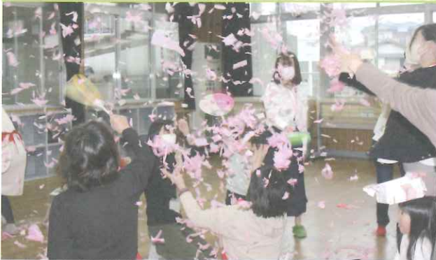
◆ 桜が舞ってるみたい (市民センター)