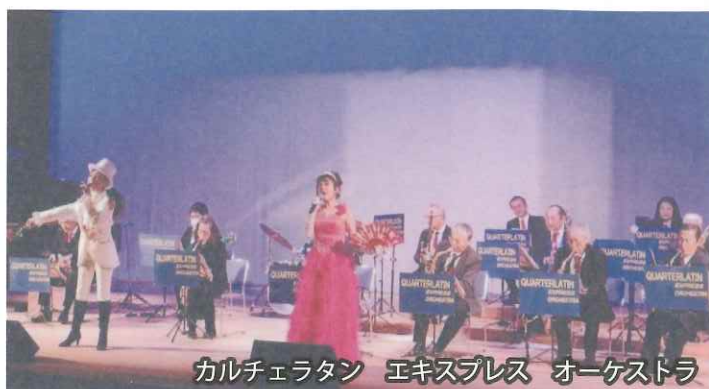
カルチェラタン エキスプレス オーケストラ