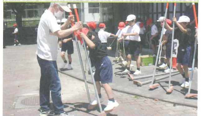
◆ ちゃんと持ってるから (岐山小学校)