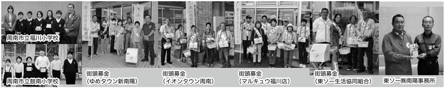
街頭募金 周南市立福川小学校