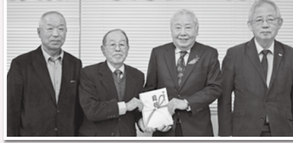
◀南陽 モラロジー 事務所 様