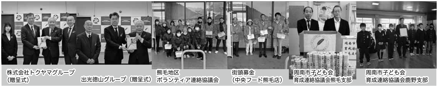
株式会社トクヤマグループ (贈呈式)