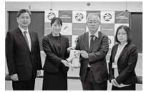
◀山口銀行徳山支店 様