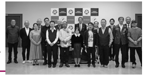
徳山ロータリー クラブ様