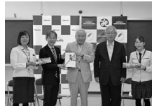
株式会社 ヤクルト山陽様